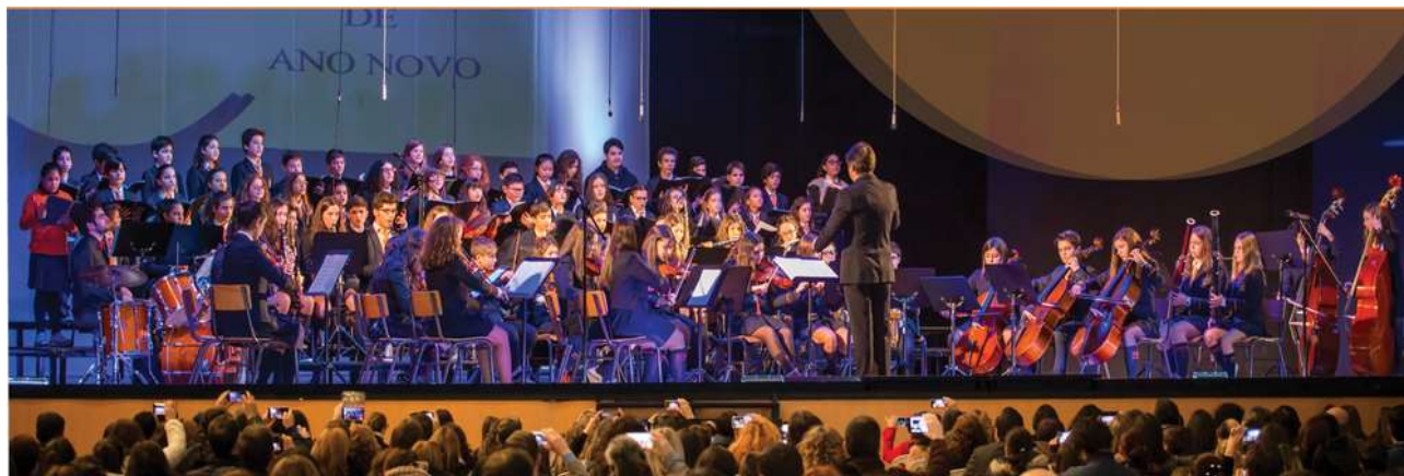
Figura 12 - Orquestra Sinfónica e Coro Didálvi

Trata-se de uma atividade promovida pelo Departamento Artístico deste Colégio e nela participarão todos os alunos do Conservatório de Música do Colégio Didálvi (Orquestra Sinfónica e Coro Didálvi).