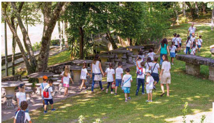
Figura 23 – Passeio na Quinta Pedagógica

A recepção destes meninos terá lugar no Auditório do Colégio Didálvi com uma atuação da Academia de Ballet e outra atuação do Conservatório de Música. Durante a manhã, os alunos terão ainda atividades no Pavilhão de Desportos, nos Laboratórios e nas Salas de Dança. Durante tarde realizarão uma visita à Quinta Pedagógica D'Alvarenga.