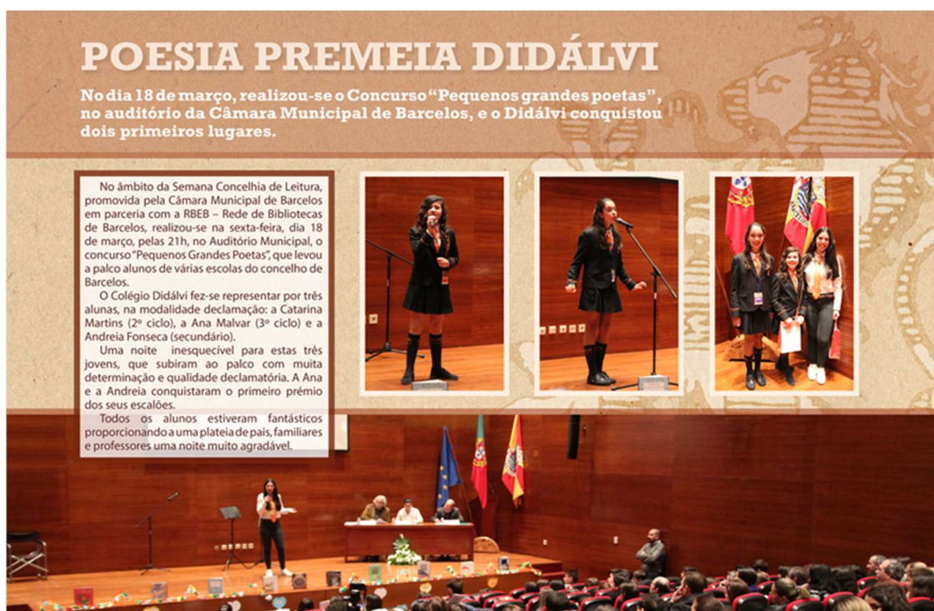
Figura 16 - Participação concelhia dos alunos vencedores do Concurso de Declamação

Os alunos que apresentem melhores capacidades de declamação irão representar o Colégio Didálvi no concurso concelhio.