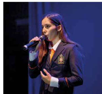
Figura 17 - Vencedora “Estrelas do Didálvi”

Como vem sendo hábito, haverá uma pré-eliminatória, que se realizará aquando do Concurso de Declamação, onde serão selecionados os três alunos que participarão na final. Esta final realizar-se-á durante a Mostra Pedagógica “Escola, Arte e Vida”, saindo de entre os três finalistas um único vencedor.