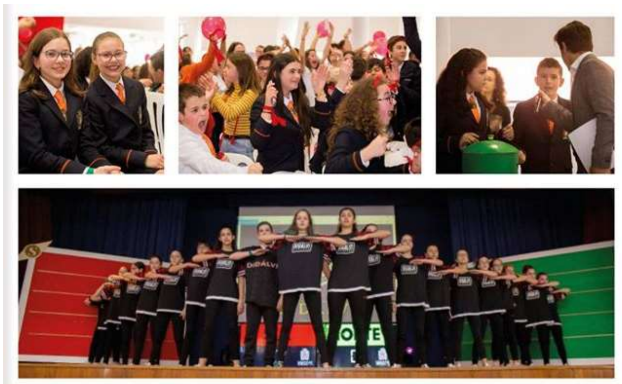
Figura 15 - Letras e Talentos