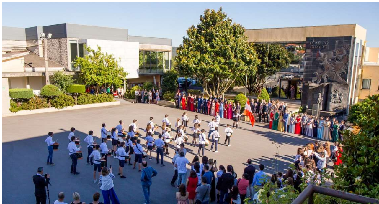
Figura 27 - Fanfarra Estudantil na receção às entidades oficiais

Exibição da Fanfarra Estudantil do Colégio Didálvi.