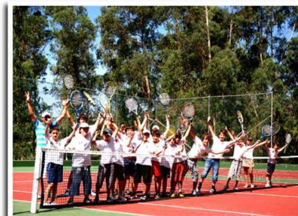
Figura 22 - Alunos participantes na Páscoa Académica - Ténis

Os alunos poderão usufruir de um programa de férias culturais, artísticas e desportivas, no Pavilhão de Desportos e na Quinta Pedagógica d' Alvarenga. Inclui: torneios de Ténis, de Futebol e de Voleibol, Clínicas de Dressage, de Saltos, de Patinagem Artística e de Golfe. O número de inscrições é limitado e têm prioridade na inscrição os alunos do Colégio Didálvi, mas podem inscrever-se, desde que haja vaga, outros alunos e convidados.