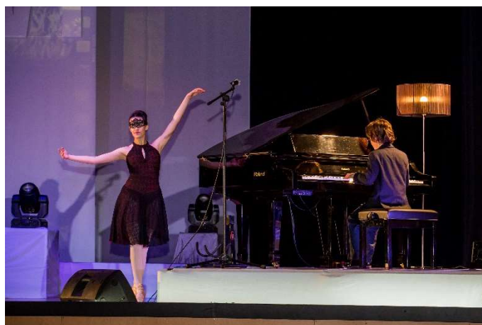
Figura 24 – Momento de ballet acompanhado ao piano

Nela participarão a Orquestra Sinfónica do Colégio Didálvi, o Coro do Colégio, a Escola de Ballet Clássico, o Clube de Danças Urbanas, o Clube de Acrobática e Trampolim, o Clube de Patinagem Artística e a Academia Gimnoarte.