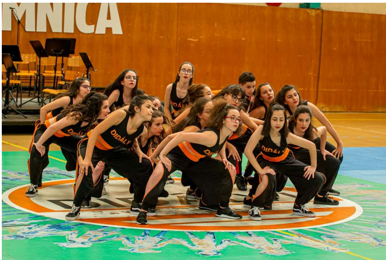
Figura 37 - Alunos do Clube de Danças Urbanas