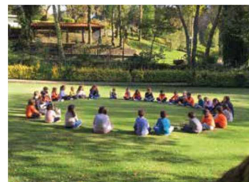
Figura 35 – Dia de S. Martinho

No dia 11 de novembro, os alunos do 1º ciclo comemorarão o Dia de S. Martinho. Estes alunos poderão conhecer e dramatizar a lenda de S. Martinho, terminando os festejos com o tradicional magusto na Quinta Pedagógica d'Alvarenga.