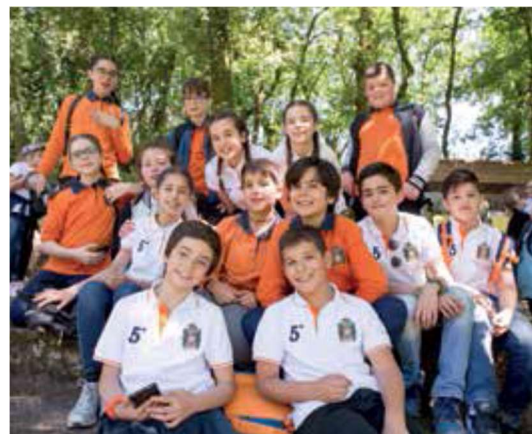
Figura 39 - Pedipaper

Ainda em abril, para comemorar a “Festa das Flores”, os alunos realizarão um pedipaper até à Quinta Pedagógica D’Alvarenga.