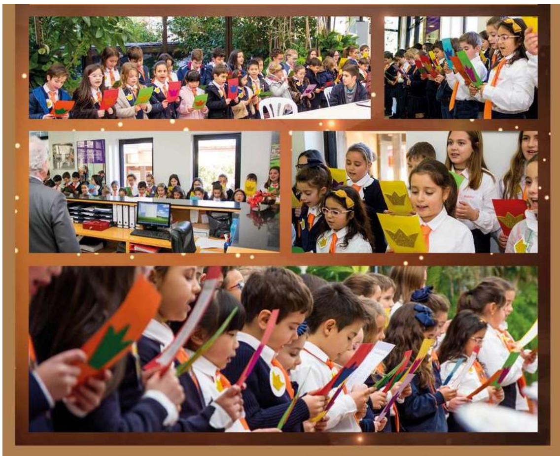
Figura 13 – “Cantar os Reis” no Colégio Didálvi

Em meados de janeiro, os alunos do Conservatório de Música do Colégio Didálvi acompanhados pelos alunos do 1º ciclo interpretarão alguns momentos musicais que ocorrerão em diferentes espaços do ambiente escolar. Em seguida, este grupo de alunos, deslocar-se-á à Casa do Povo de Alvito, proporcionando aos idosos que lá vivem uma tarde diferente e bem animada.