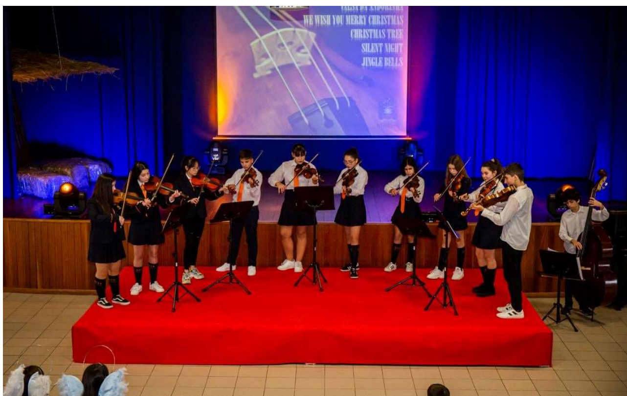
Figura 10 - Ensemble de Violinos na Festa do Natal