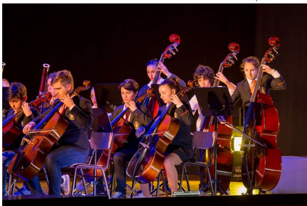
Figura 2 - Alunos da Orquestra do Colégio Didálvi