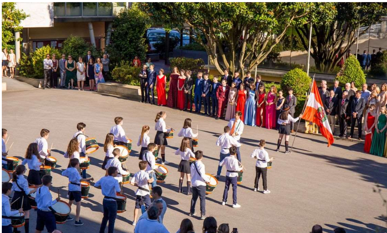
Figura 4 – Fanfarra Estudantil no Colégio Didálvi