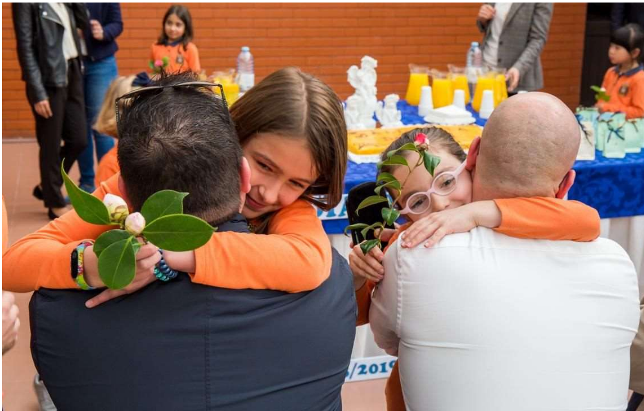
Figura 19 – Comemoração do Dia do Pai

A atividade contará com animação musical por parte dos alunos do Conservatório de Música.