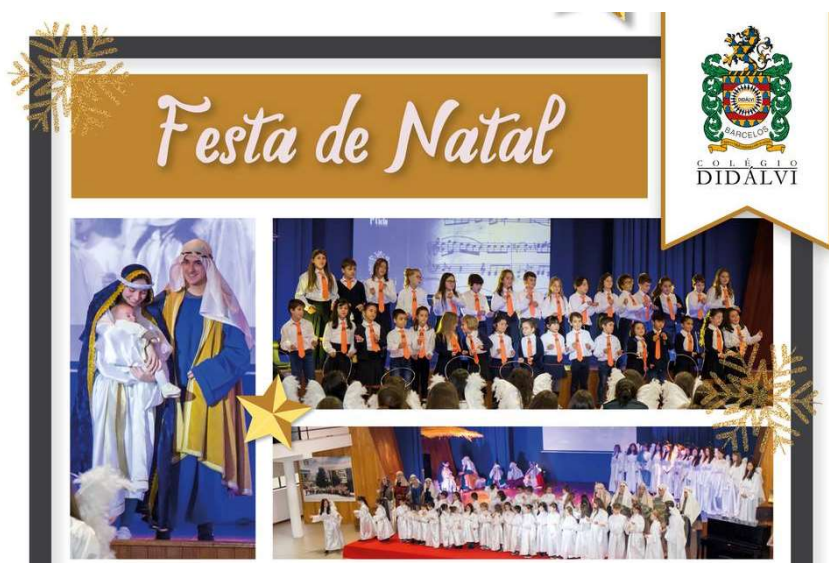
Figura 9 – Festa de Natal

A Celebração de Natal terá lugar no final do primeiro período, no Auditório do colégio. A sua organização é da responsabilidade do Departamento de Línguas e Humanidades, de acordo com as orientações dos professores de . Participam nesta atividade alguns clubes desportivos, as turmas do 12º ano (responsáveis pelo auto de Natal), a Orquestra Sinfónica do Colégio Didálvi e o Coro Didálvi.