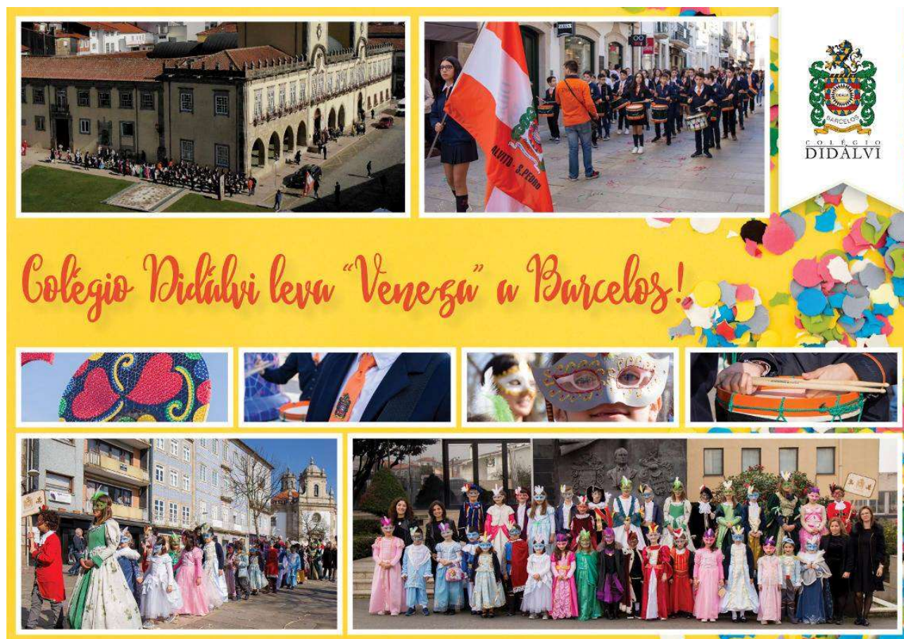
Figura 14 – Participação no desfile de Carnaval na cidade de Barcelos