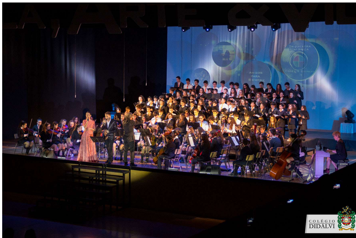
Figura 25 - Escola Arte e Vida - Atuação da Orquestra Sinfónica e Coro Didálvi