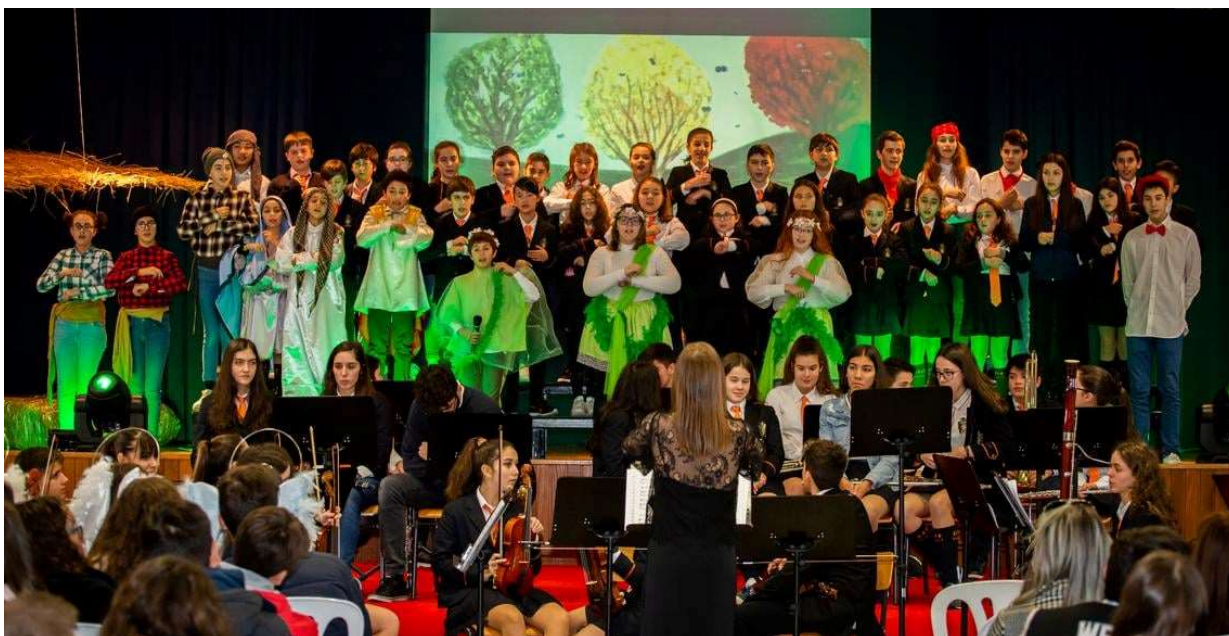
Figura 7 – Coro Didálvi a interpretar “A Lenda das Três Árvores”

Da responsabilidade do Departamento Artístico do Colégio Didálvi, as audições são momentos de palco para os jovens músicos do Conservatório de Música deste Colégio. Tempo de audições e avaliações, tempo também para os pais e alguns familiares poderem assistir à atuação dos seus filhos e acompanhar, assim, a sua evolução.