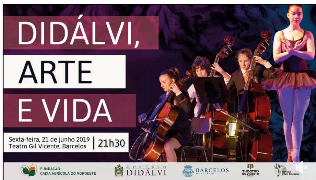
Figura 26 – Cartaz “Didálvi, Arte e Vida”

Este espetáculo realizar-se-á, em maio, no Theatro Gil Vicente em Barcelos. Contará com a presença da Orquestra Sinfónica do Colégio Didálvi e a Escola de Ballet Clássico.