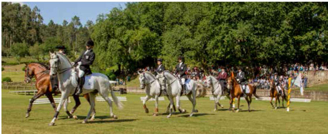
Figura 32 - Atuação do clube de Hipismo

Durante a tarde, alunos e familiares serão brindados com várias apresentações da responsabilidade dos clubes do Colégio: Clube de Danças Urbanas, Escola de Ballet Clássico, Patinagem Artística, Clube de Acrobática, Futebol, Ténis, Esgrima, Golfe e Equitação. Primeiro, um desfile e, depois, as várias atuações.