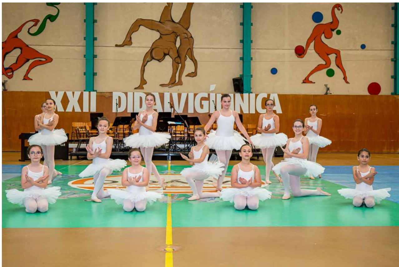
Figura 38 – Alunos do Clube de Ballet