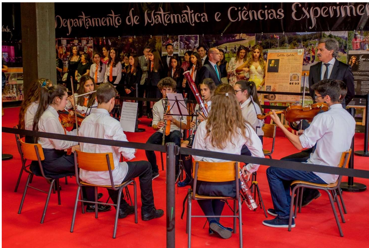
Figura 28 – Conservatório de Música na receção às entidades oficiais

19.00h – Sessão Solene comemorativa do aniversário do Colégio Didálvi e encerramento do ano letivo, com a participação da Orquestra do Colégio Didálvi.