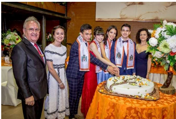
Figura 31 - Corte do bolo pelos finalistas