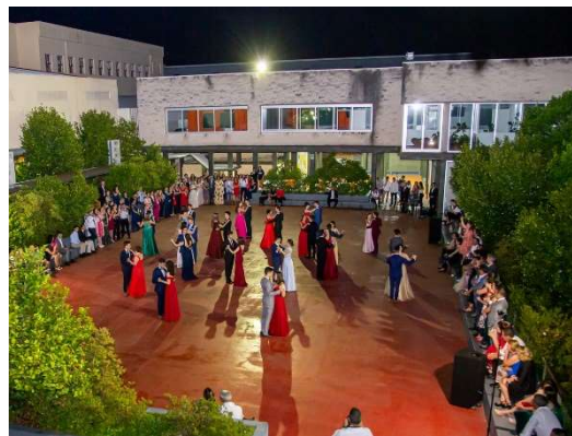
Figura 30 – Baile dos finalistas