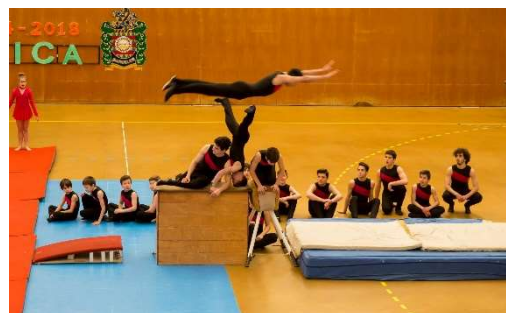
Figura 36 - Execução de número acrobático

Esta atividade contará com apresentações dos diferentes clubes do colégio.