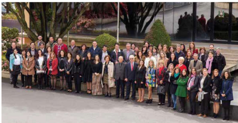
Figura 21 - Dia do Colégio

Por último, a celebração deste dia culminará com um almoço / convívio animado pelos professores do Ensino Artístico Especializado da Música.