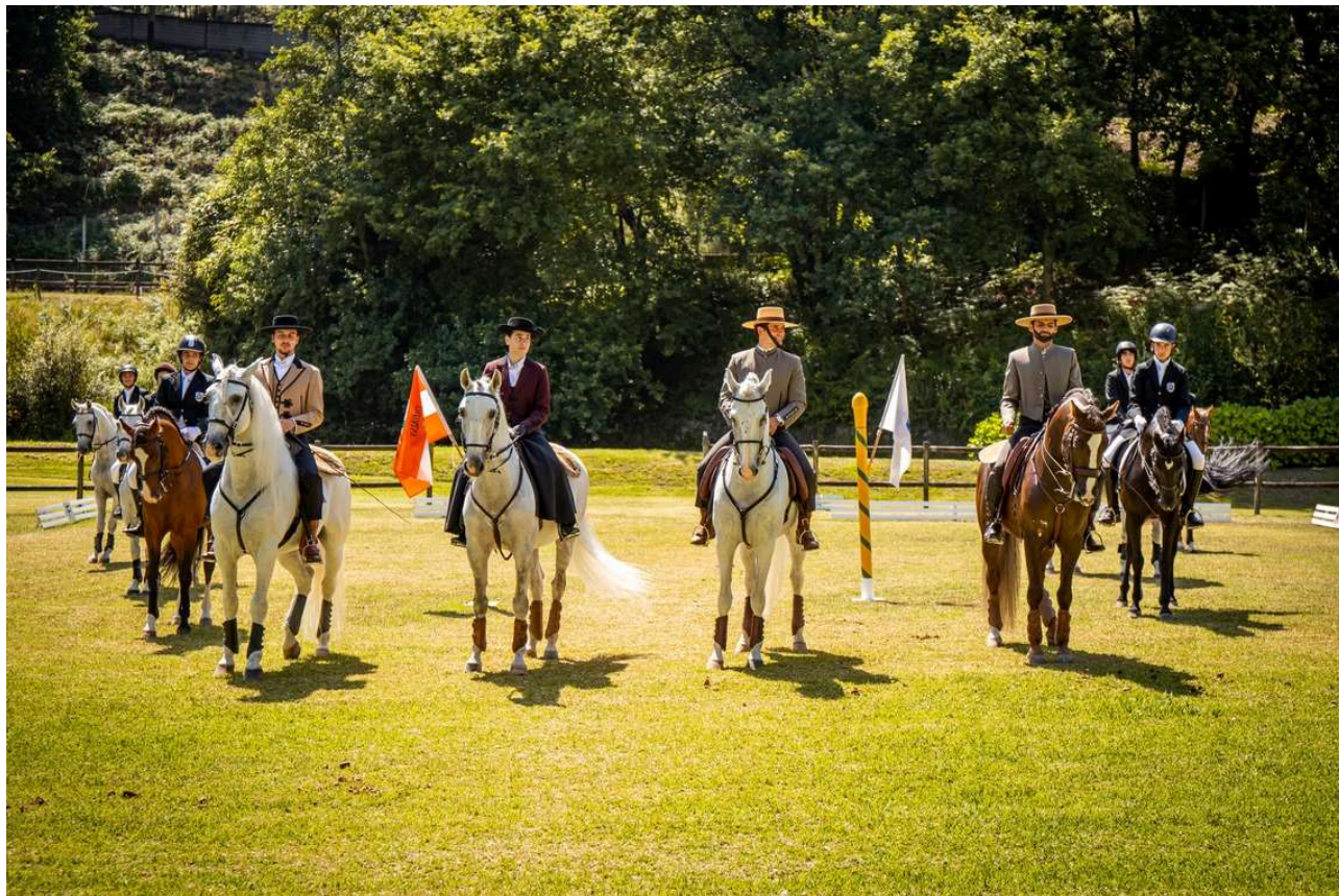
Figura 11 - Quinta Pedagógica

O número de inscrições nos torneios é limitado e têm prioridade na inscrição os alunos do Colégio Didálvi, mas podem inscrever-se, desde que haja vaga, outros alunos e convidados.