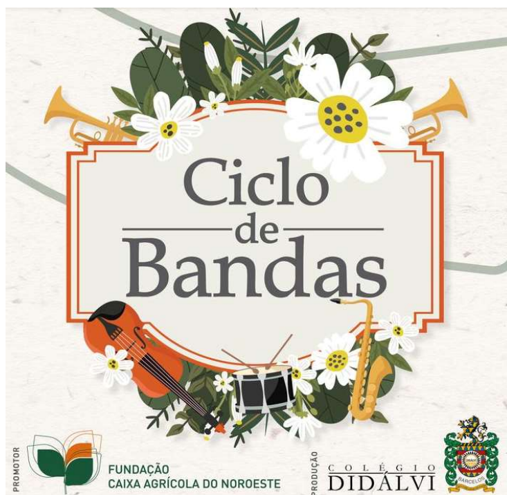
Figura 18 – Cartaz “Ciclo de Bandas”

Em abril, na Quinta Pedagógica d’ Alvarenga, em colaboração com a Fundação da Caixa Agrícola do Noroeste, realizamos o Ciclo de Bandas de Música.