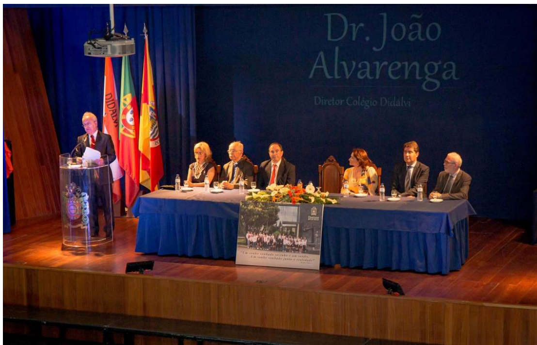
Figura 29 - Sessão Solene

19.00h – Sessão Solene comemorativa do aniversário do Colégio Didálvi e encerramento do ano letivo, com a participação da Orquestra do Colégio Didálvi.