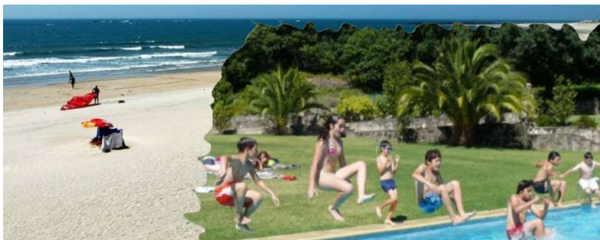
Figura 34 – Praia de Ofir / Piscina da Quinta Pedagógica d'Alvarenga

O número de inscrições é limitado e têm prioridade na inscrição os alunos do Colégio Didálvi, mas podem inscrever-se, desde que haja vaga, outros alunos e convidados.