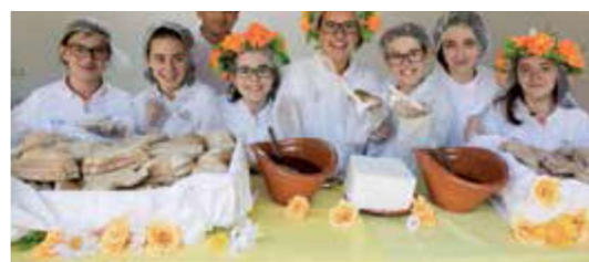
Figura 40 - Participantes do lanche biológico

Depois da caminhada seguir-se-á o já habitual lanche biológico (pão com mel) que decorrerá ainda na Quinta Pedagógica D’Alvarenga.