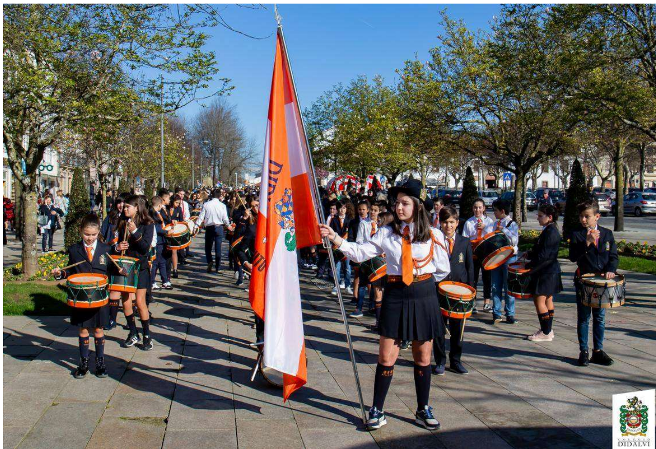
Figura 3 – Fanfarra Estudantil em Barcelos

Ao longo de todo o ano letivo, como vem sendo hábito, a Fanfarra Estudantil do Colégio Didálvi animará diferentes eventos culturais na região.