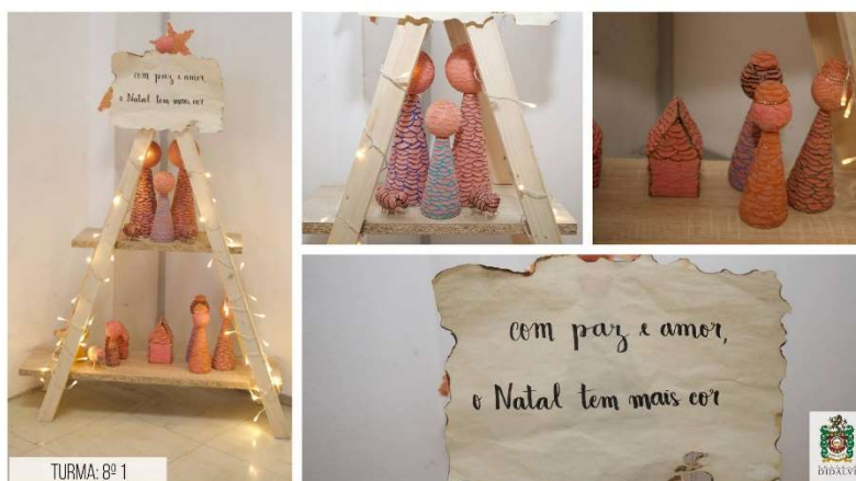
Figura 8 - Presépio vencedor

A Festa de Turma decorrerá depois de elaborado o presépio. O diretor de turma deve acautelar as desigualdades na hora da troca de prendas, combinando previamente um valor máximo e mínimo para a mesma de forma a não suscitar situações melindrosas.